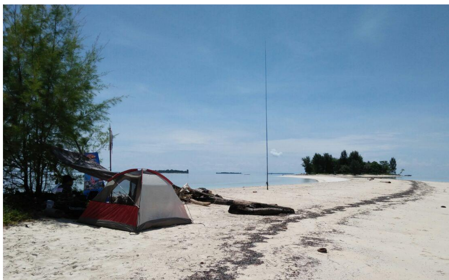
Kegiatan IOTA DXPEDITION di pulau dengan menggunakan Tenda