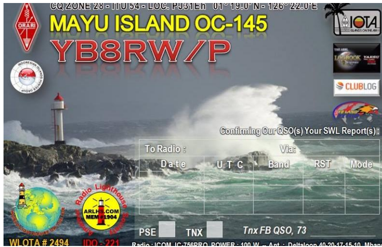
CONTOH QSL CARD IOTA SINGLE OPERATOR IOTA